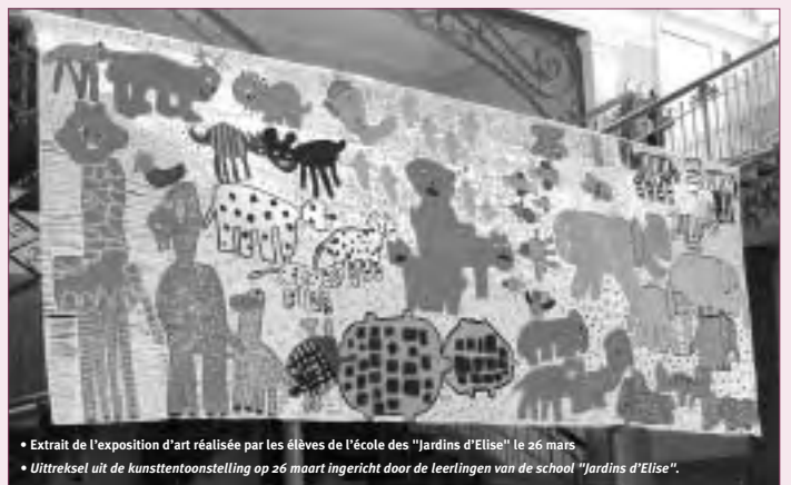
• Extrait de l'exposition d'art réalisée par les élèves de l'école des "Jardins d'Elise" le 26 mars. • Uittreksel uit de kunsttentoonstelling op 26 maart ingericht door de leerlingen van de school "Jardins d'Elise".

Pour les enfants, une école, c'est bien plus que des cours; c'est aussi un endroit convivial pour déjeuner et des expériences enrichissantes d'ouverture au monde et aux autres (projets culturels, sportifs, de solidarité, classes vertes,...).