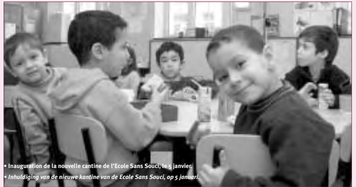
• Inauguration de la nouvelle cantine de l'Ecole Sans Souci, le 5 janvier. • Inhoudiging van de nieuwe kantine van de Ecole Sans Souci, op 5 januari.