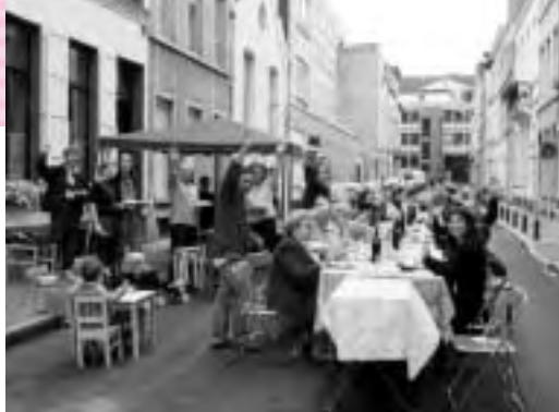
RUE CITOYENNE RUE LORAND

☎ Informations: www.kbs-frb.be, tél.070-233 065