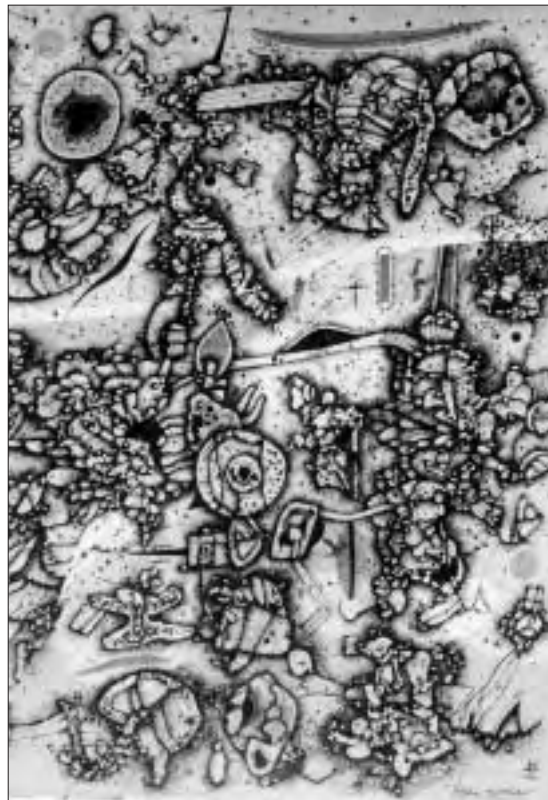
JACQUES LACOMBLEZ © GALERIE QUADRI

☎ Infos: 02 640 95 63 📅 Du 2/6 au 3/7, tous les samedis 14 à 18h ou sur rendez-vous.