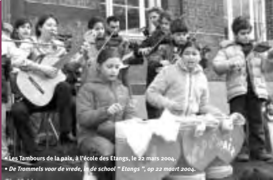
• Les Tambours de la paix, à l'école des Etangs, le 22 mars 2004. • De Trammets voor de vrede, in de school "Etangs", op 22 maart 2004.