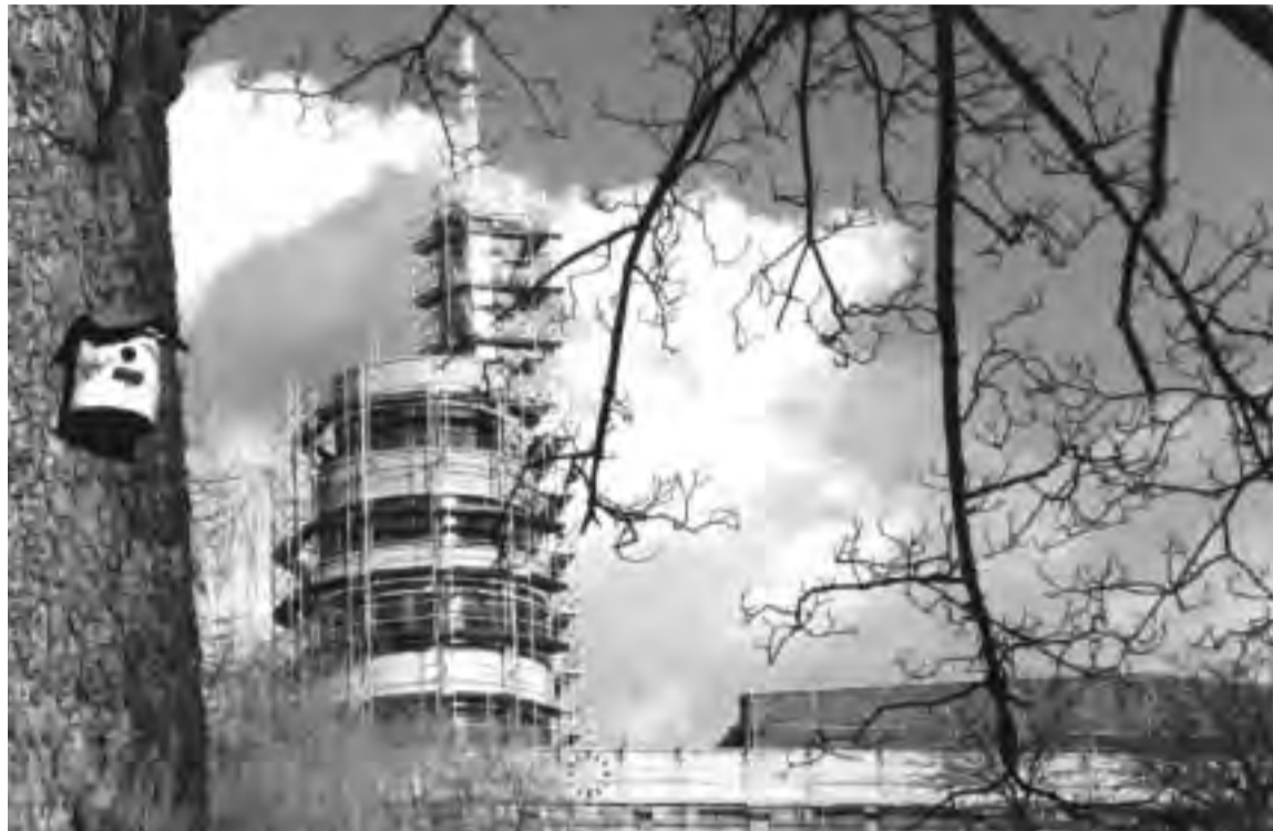
Les deux photos du "Paquebot" (pages 2 et 3) sont signées par Ben Dechamps, photographe ixellois à découvrir sur http://benchri.be/tf/

D'importantes manifestations (Festival van Vlaanderen, Ars Musica,...) trouveront à Flagey un environnement propice à leur redéploiement. Il y a également lieu de souligner le fait que, grâce à un subside en investissement de la Commune, le "Paquebot" naviguera sur des eaux cinématographiques. En effet, la Commune a tenu à soutenir, à sa manière, l'entreprise de redéploiement culturel que constitue le renouveau de Flagey et proposera au Conseil du 5 septembre l'octroi d'un subside de 595.000 euros pour l'acquisition et l'implantation d'un équipement cinématographique de premier choix.