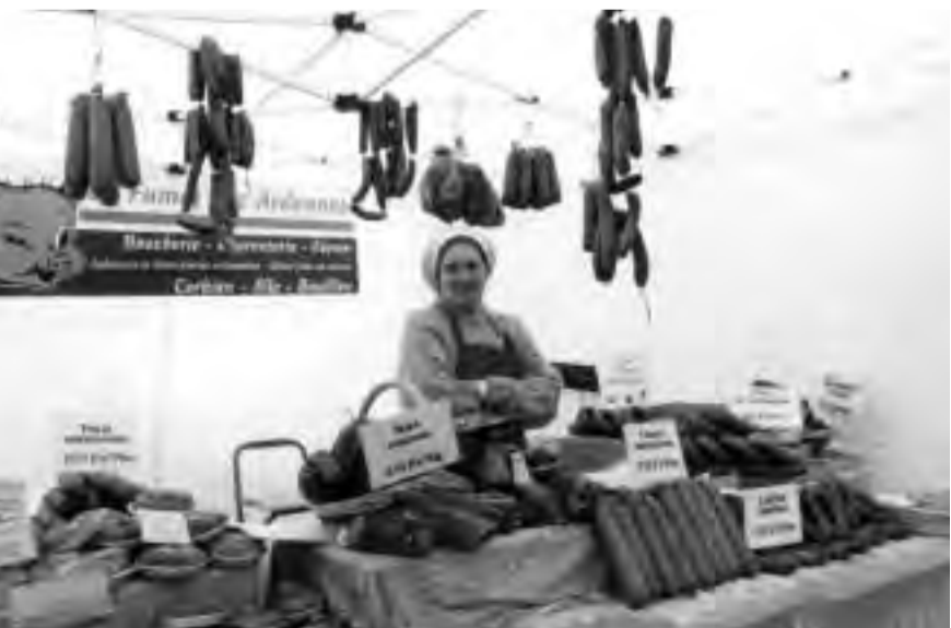
Le Marché Artisanal des Producteurs Luxembourgeois en 2001