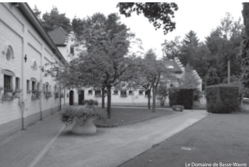
Le Domaine de Basse-Wavre