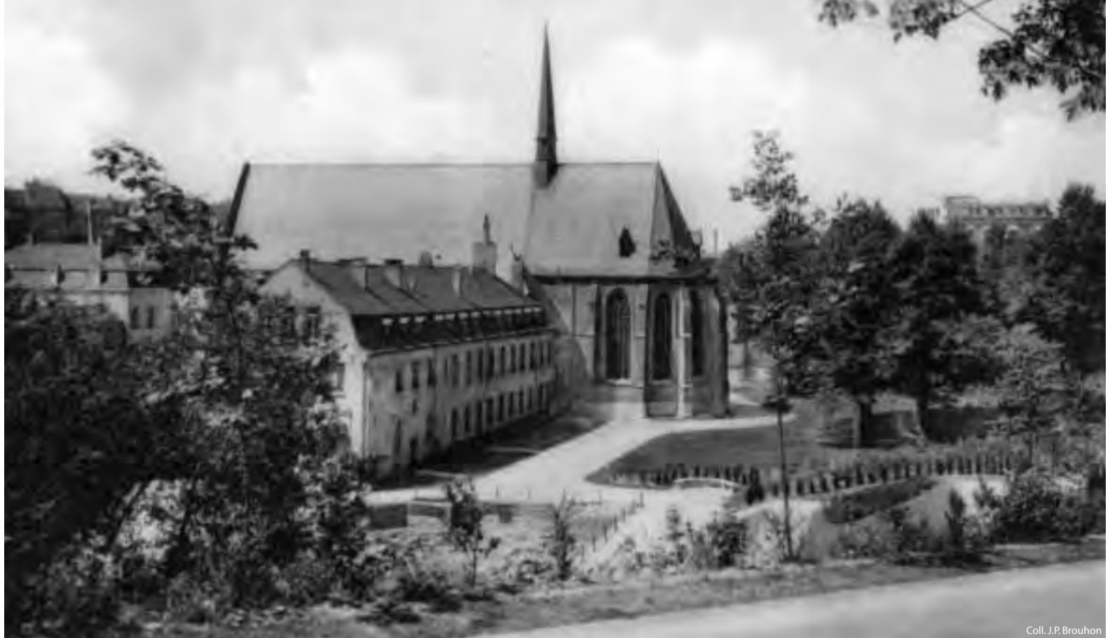
Coll. J.P. Brouhon

En début d'année, nous rappelons que les parents ont le choix d'inscrire leurs enfants soit au repas complet, soit au repas pique-nique. La tarification est la suivante: repas complets: 2,30 EUR pour les maternelles, 2,50 EUR pour les primaires et 2,60 EUR pour les secondaires. Repas pique-nique: 0,35 EUR pour la surveillance et le service de table. Le service social communal peut intervenir pour les familles qui éprouveraient des difficultés de paiement. Rens: Direction des Affaires Sociales – Service des repas: 02 515 60 53